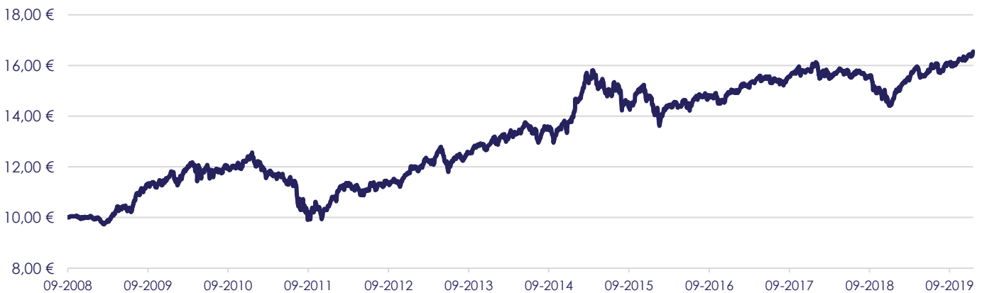
Gráfico de Evolução do Valor das Unidades de Participação em Euros, desde a Criação do Fundo