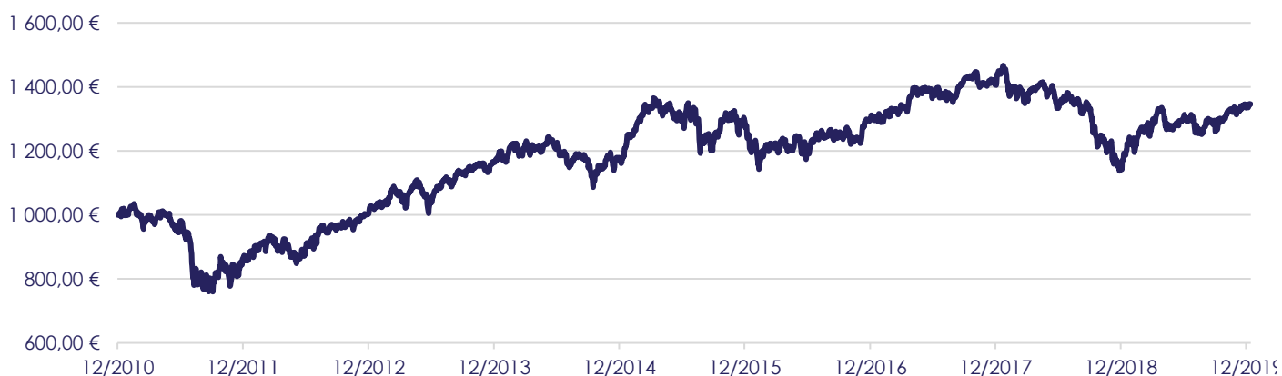
Gráfico de Evolução do Valor das Unidades de Participação em Euros, desde a Criação do Fundo