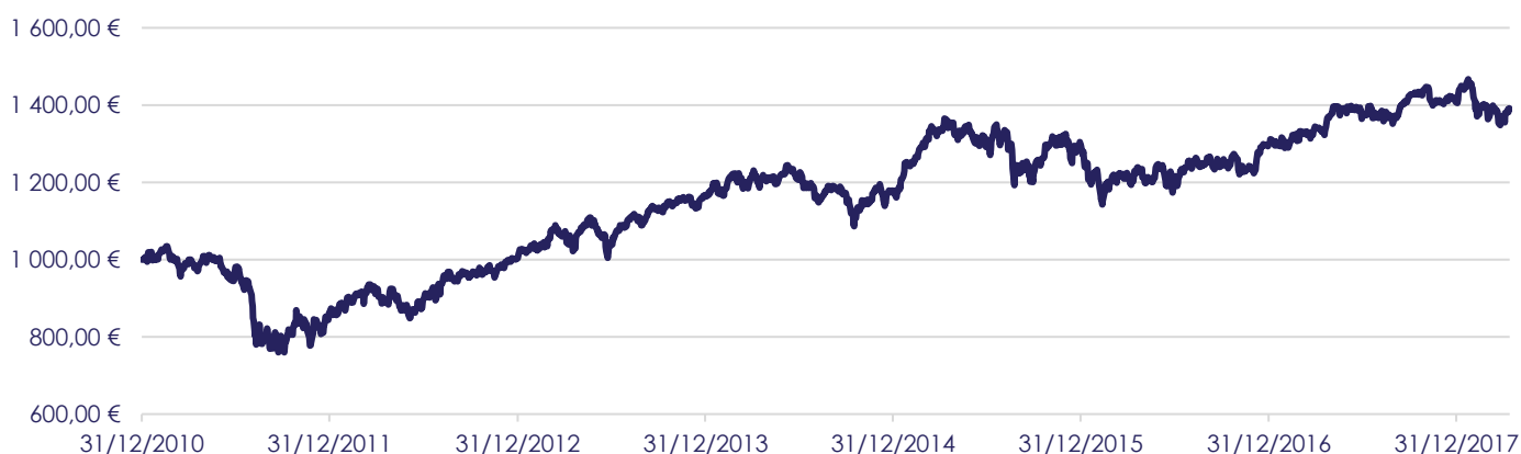
Gráfico de Evolução do Valor das Unidades de Participação em Euros, desde a Criação do Fundo