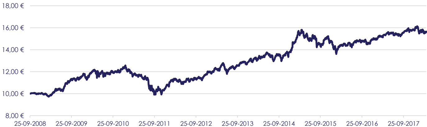
Gráfico de Evolução do Valor das Unidades de Participação em Euros, desde a Criação do Fundo