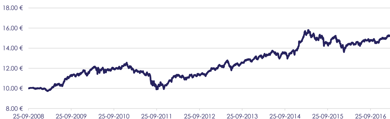
Gráfico de Evolução do Valor das Unidades de Participação em Euros, desde a Criação do Fundo