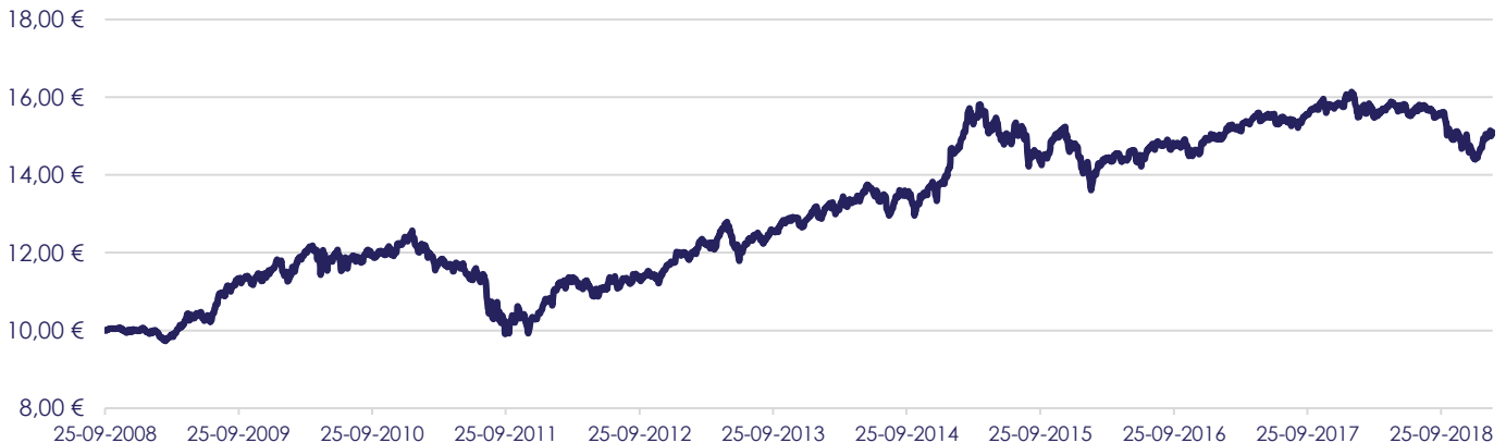
Gráfico de Evolução do Valor das Unidades de Participação em Euros, desde a Criação do Fundo