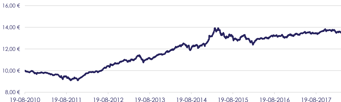
Gráfico de Evolução do Valor das Unidades de Participação em Euros, desde a Criação do Fundo