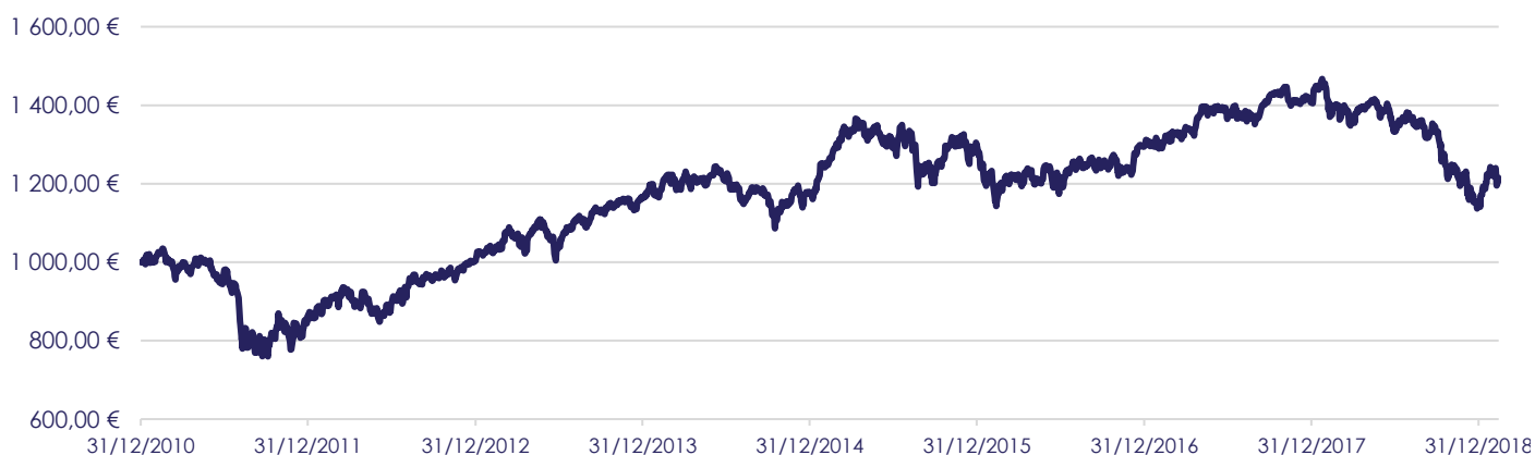
Gráfico de Evolução do Valor das Unidades de Participação em Euros, desde a Criação do Fundo