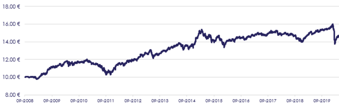
GRÁFICO DE EVOLUÇÃO COMPARADA DESDE INÍCIO DO FUNDO

O fundo não adota parâmetro de referência.