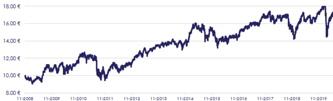
GRÁFICO DE EVOLUÇÃO DESDE INÍCIO DO FUNDO

O fundo não adota parâmetro de referência.